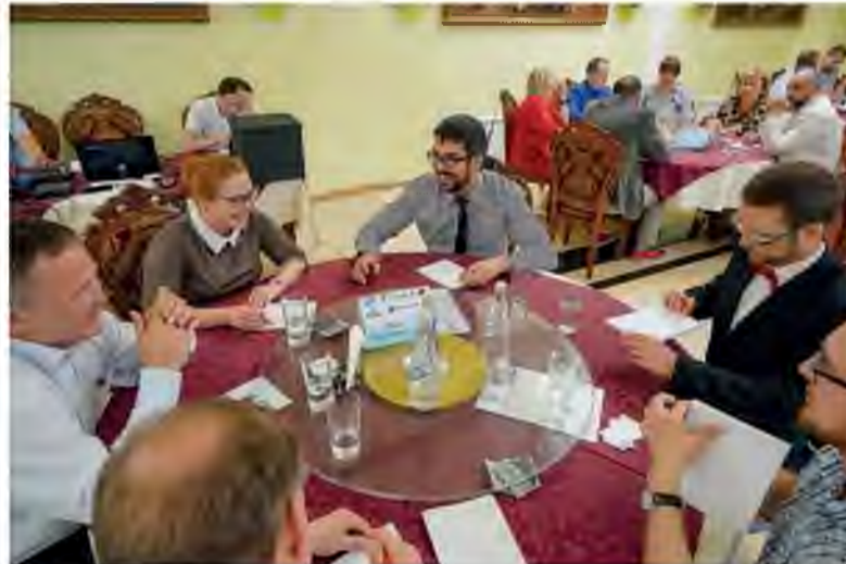
Команда знатоков Тольяттиазота знает ответ на непростой вопрос

– Не все получилось в этом году, как задумали, но постарайтесь учесть ошибки, обидно что могли претендовать на пьедестал, за столом были правильные версии, но для нас они были равнозначны, и в итоге выбрали неверный ответ. Но мы будем тренироваться участвовать в Табуретке, осеннем кубке города по ЧГК, чтобы в следующем году постараться