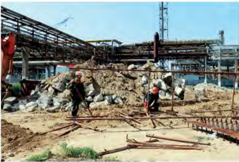
Строительство отделения компрессии №3 в разгаре