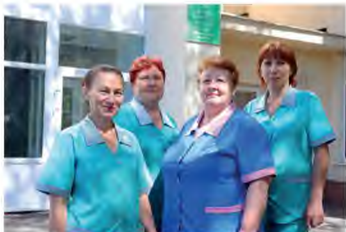
В медсанчасти – как в операционной! За чистотой здесь следят санитарки