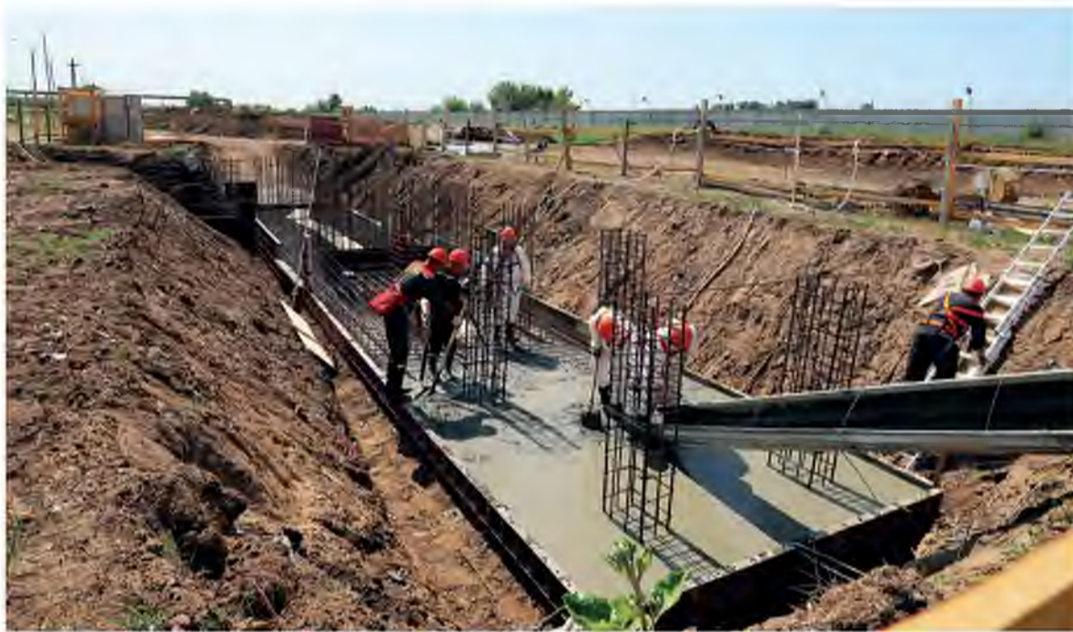
Бетонный узел будет работать до окончания строительства третьего агрегата карбамида

Кроме того, расчищена площадка и подготовлен котлован под строительство подстанции №3, которая полностью обеспечит