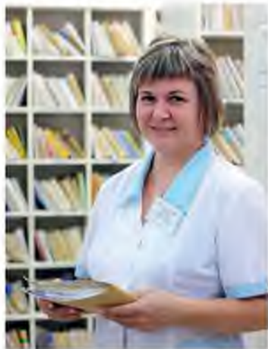
В регистратуре медсанчасти хранят более 4000 карточек