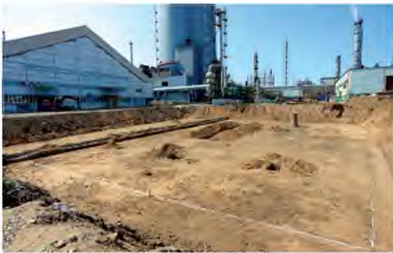
Гранбашня станет самым высоким сооружением на третьем агрегате карбамида