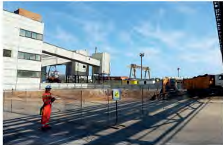
Продолжается устройство фундамента для подстанции